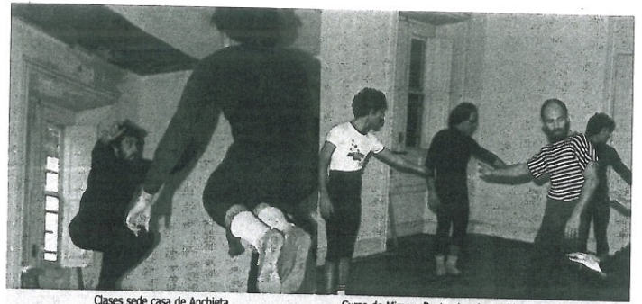
Clases sede casa de Anchieta

El resultado de ambas circunstancias propició irrepetibles vivencias y una continua acción teatral.