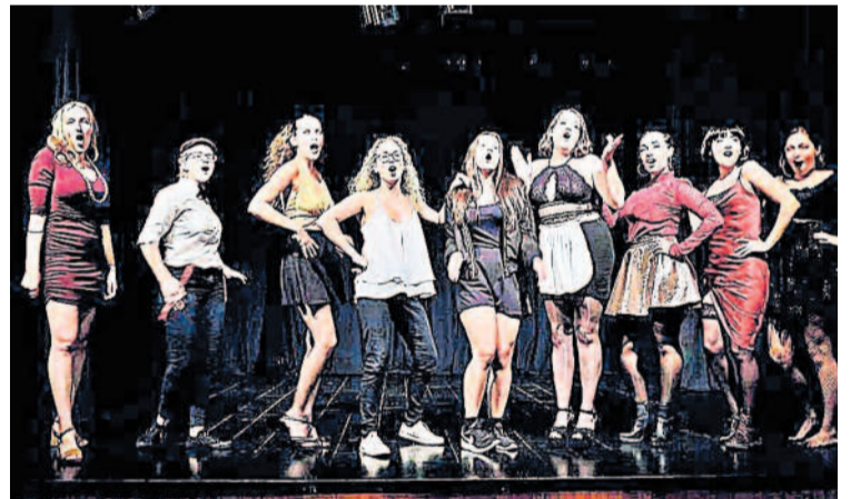
Estudiantes del título superior de arte dramático en una escena de 'Cabaret'.

Para participar en las PRUEBAS DE ACCESO es necesario estar en posesión del título de Bachiller, estudios equivalentes, o haber superado la prueba de acceso a la